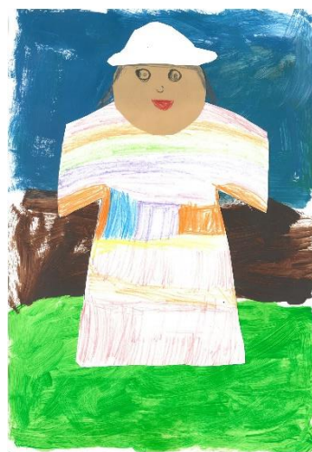
Terezie Koželuhová, Tereza Omelková, 9. A

Nám se hra osobně líbila a moc se těšíme na další představení.