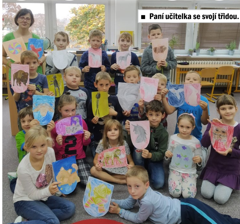
Paní učitelka se svojí třídou.

Učím v montessori systému a tam je jedním z principů, že se děti v podstatě učí samy. Já jim nachystám pomůcky a ony na to pomocí nich přijdou. Nemají tedy definice a hotová řešení. Nyní jim to předkládám již jako učitelka a děti o tuto možnost přišly. I když jim nahrávám videa a některé pomůcky nabízím, už je nemohu vést. Tím se mi úplně změnila příprava na výuku. Děti musejí více číst a psát v sešitech. Všimám si, jak je často zadání napsáno nesrozumitelně, a společně hledáme řešení. Také hledám možnosti procvičení na počítači. Objevují nové programy a způsoby výuky přes počítač.